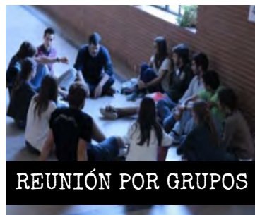
REUNIÓN POR GRUPOS