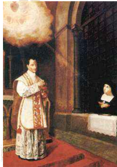
San Claudio y Sta. Margarita: Dos corazones unidos en el de Jesús. Sobre sus restos mortales. Esta oleo esta sobre sus restos mortales en su iglesia en Paray le Monial.

En realidad, se trataba de un designio de Dios para ponerle en contacto con un alma que necesitaba de su ayuda: Margarita